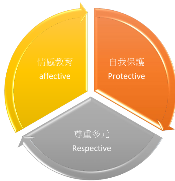
圖一、112 年度性別平等推廣計畫核心