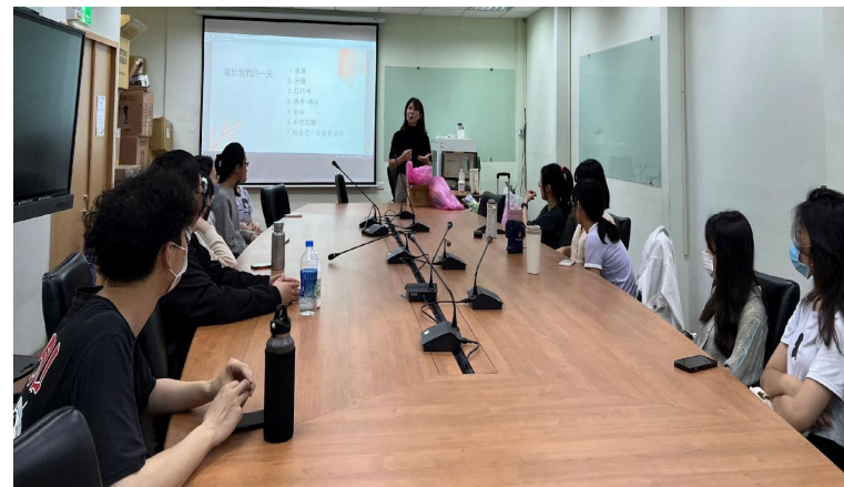
電影賞析及工作坊